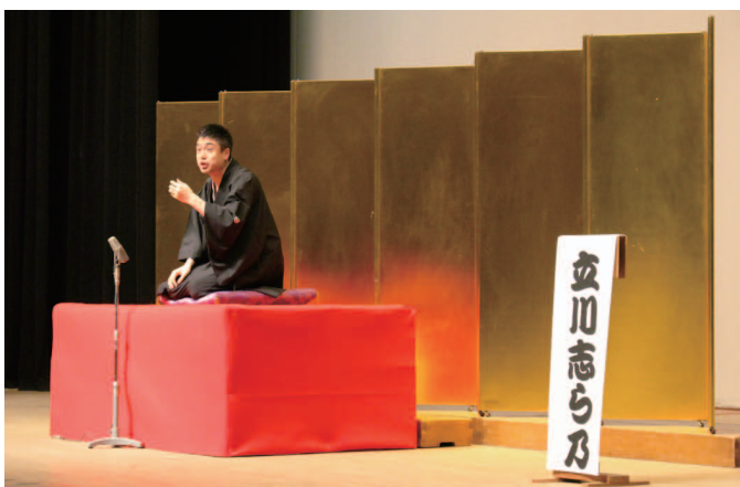
落語を披露する立川志ら乃師匠