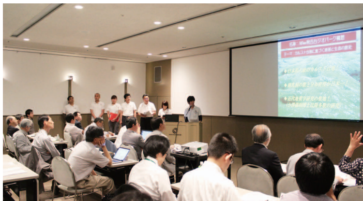
写真1 審査員に対してプレゼンテーションを行う様子

市報「げんきみね。」やMYTでもお伝えしていますが、本地域は今年度の日本ジオパーク認定を目指しています。まず、4月20日（月）にMine秋吉台ジオパーク構想についてまとめた申請書を提出しました。続いて5月23日（土）には、審査を行う日本ジオパーク委員会の委員に対してプレゼンテーション（口頭発表）を行いました（写真1）。そして、審査員が本地域を見てまわる