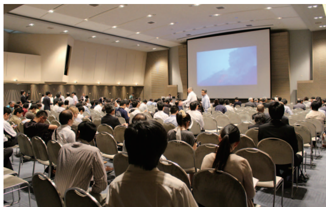
写真2 ジオガイドの話を聞く大会参加者

現地審査が8月6・7日にあります。名前は「現地審査」と言いますが、実際は審査員とジオパーク活動を行う地域の方や団体との「交流」がメインとなります。地域の皆様のご協力が不可欠ですので、是非とも積極的なご参加をよろしくお願ひします（具体的な参加方法などについては、来月号でご案内します）。