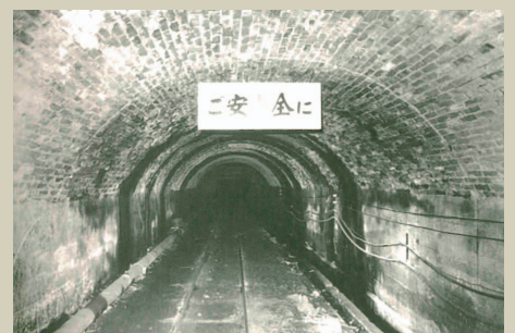
大嶺炭田回顧録「むえんたん」より