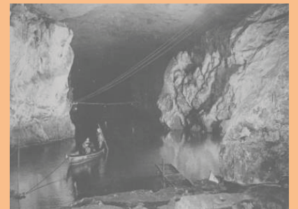
秋芳洞内を進む木船

引用①: https://upload.wikimedia.org/wikipedia/commons/2/25/Lienchiangadm.PNG 引用②: https://www.matsu-nsa.gov.tw/user/Article.aspx?a=6&l=3