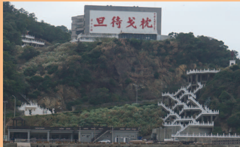
5階建ての建物に書かれている「枕戈待旦」