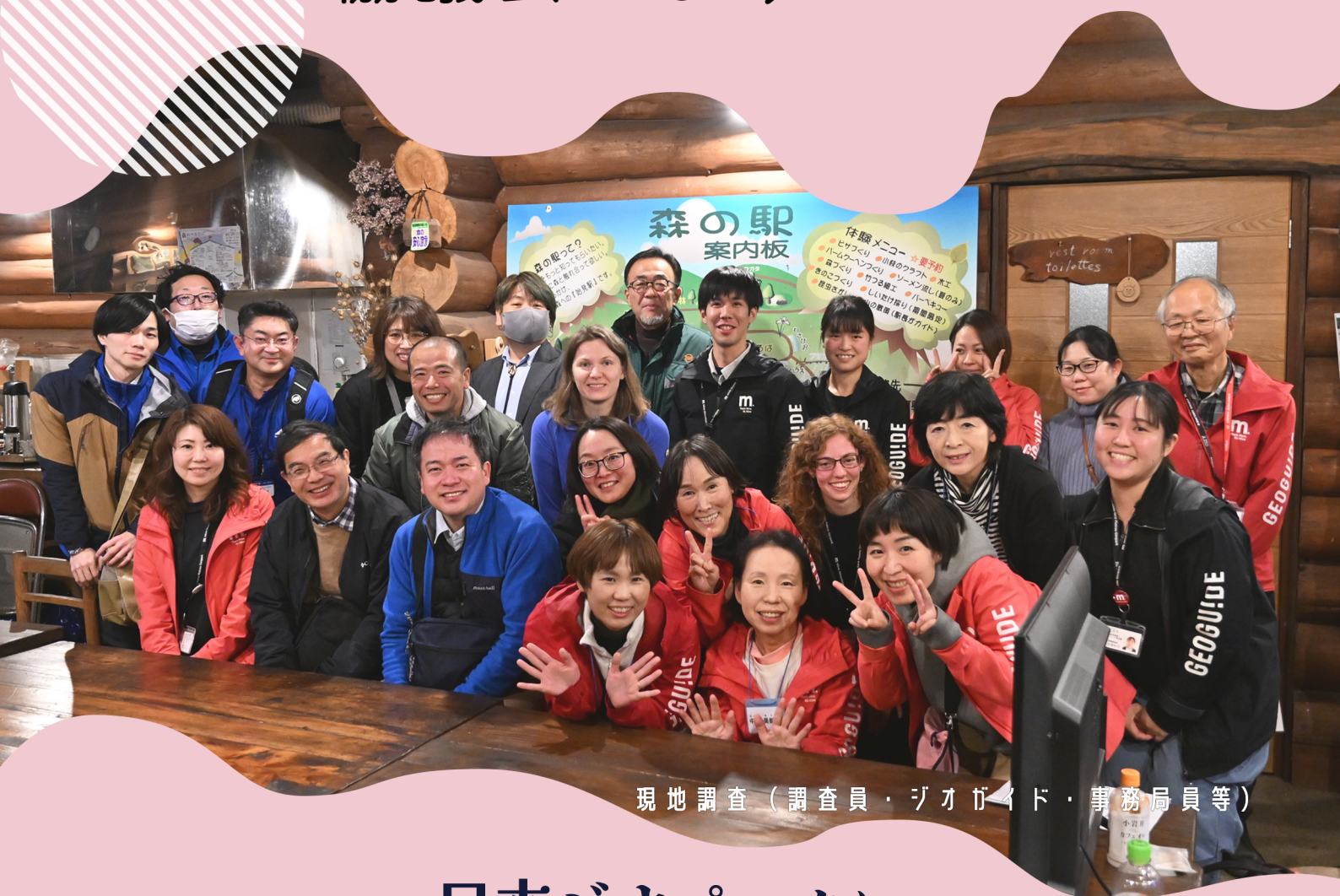
現地調査（調査員・ジオガイド・事務局員等）